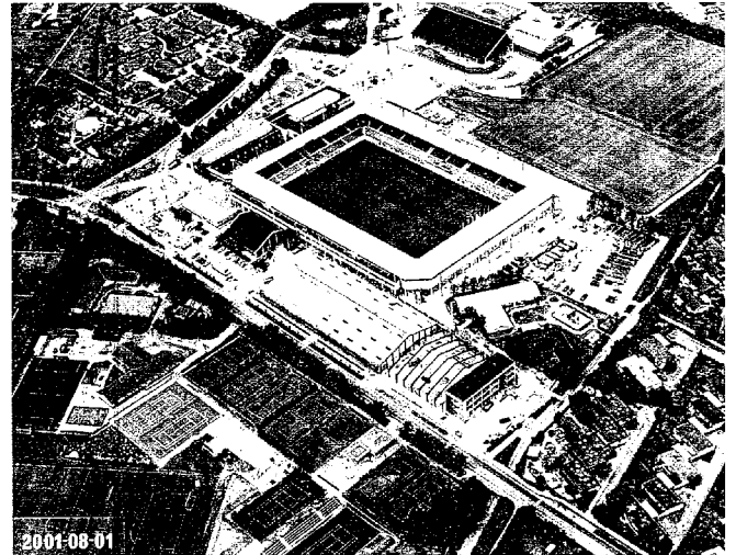
Udvidelse af indendørsanlæg fra 4 til 6 baner i 2001. Bemærk hvordan området har forandret sig radikalt siden opførelsen af tennishallen 12 år tidligere.