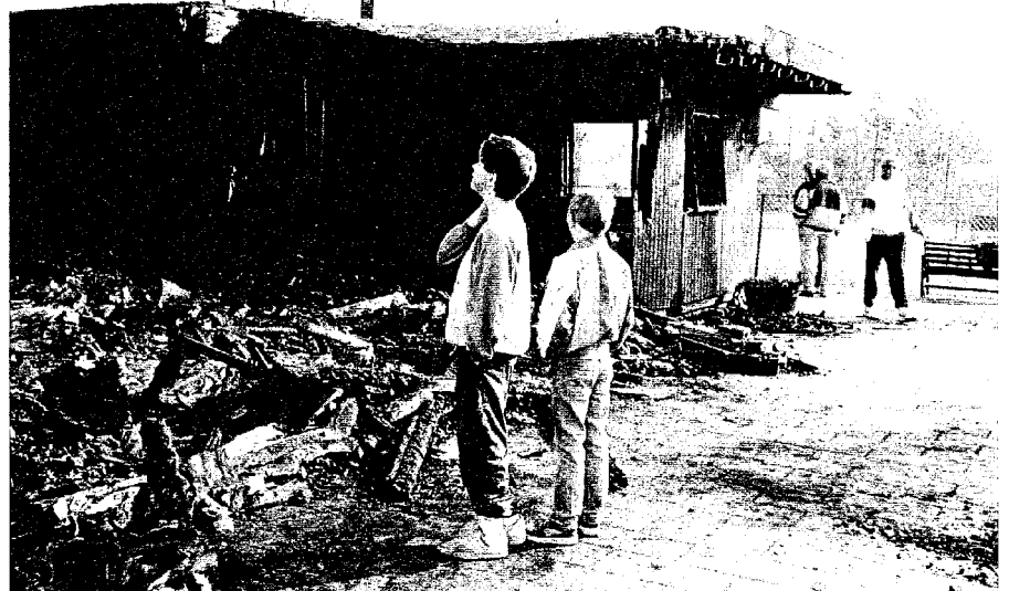
En sorgens dag i FTK, da klubbens klubhus nedbrændte. Med klubhuset forsvandt et skattet tilhørssted, som for mange var forbundet med glade og sjove minder.

Det kunne klubben profitere af, idet der i aftalerne lå en forpligtelse til at renovere og modernisere hal og udendørs anlæg. Hallen blev herefter "opgraderet", så den i dag fremstår som en hyper moderne hal med det sidste nye i gulvbelægning.